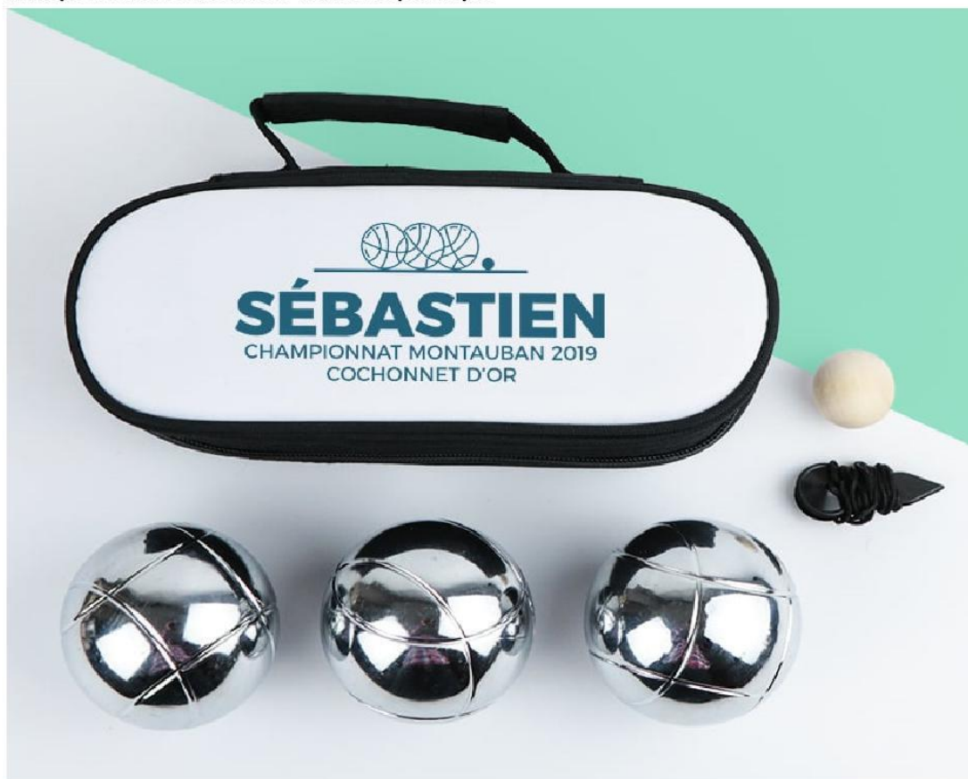
Exemple : La Sacoche et ses 3 boules de pétanque