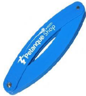
Cercle de Lancer