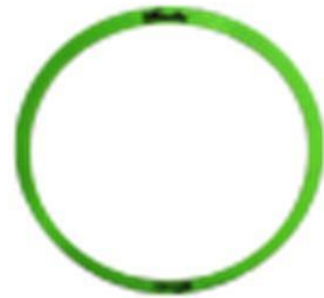
Cercle de Lancer