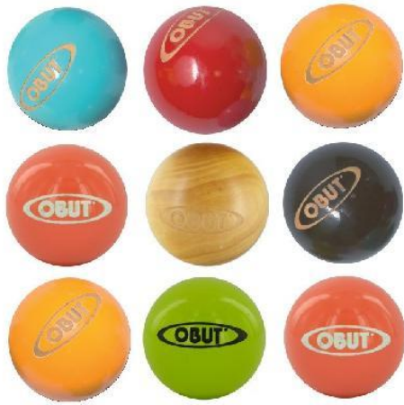
BUT de Pétanque